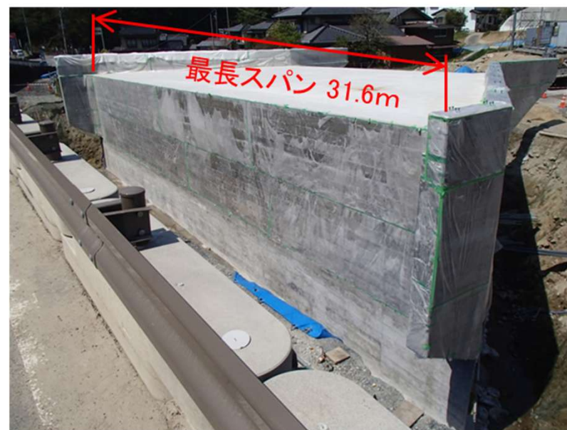
完成写真 (左岸上流より)